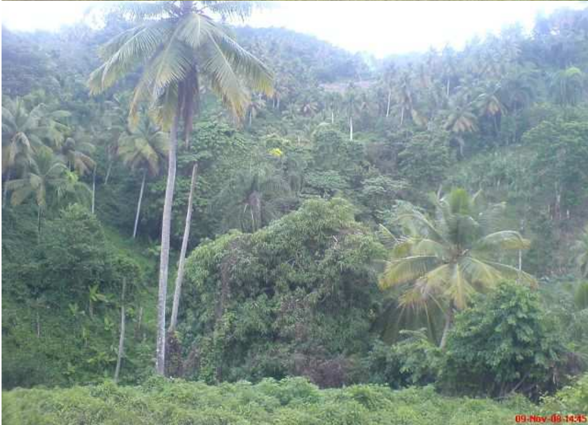
Terreno en el centro de la ciudad de samaná.docx